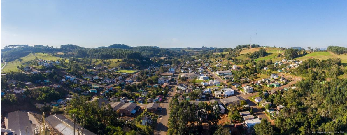
Foto do Novo Centro Administrativo do Município