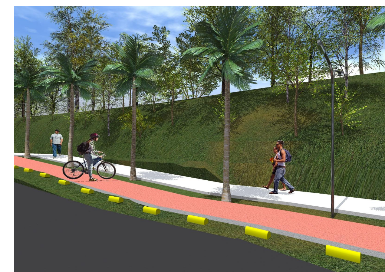
CICLOVIA/PASSEIO PÚBLICO 3D