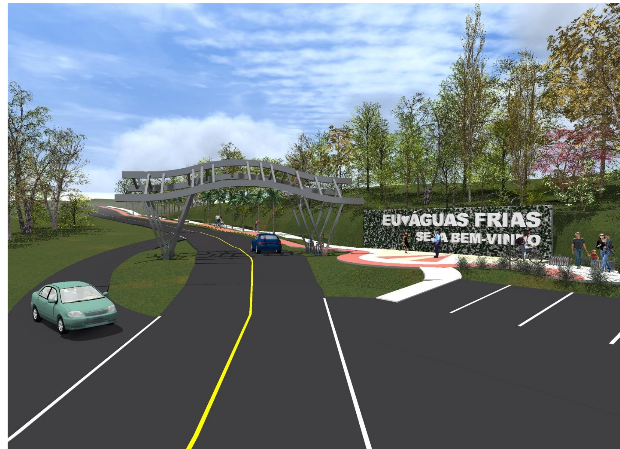
PÓRTICO/PRAÇA SECA 3D