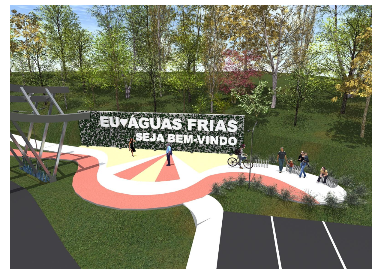
PRAÇA SECA 3D