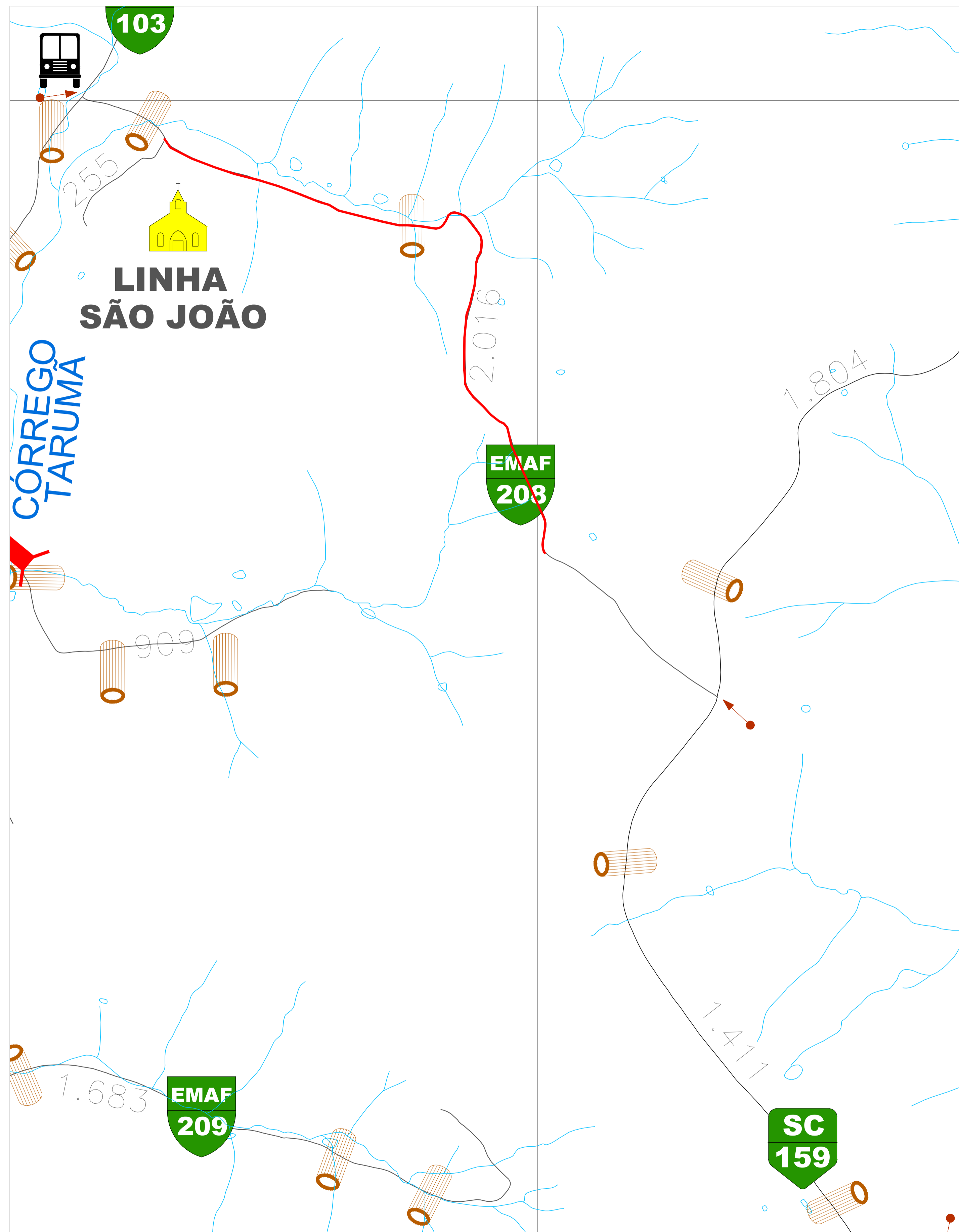
1 LOCALIZAÇÃO Escala: 1/5000