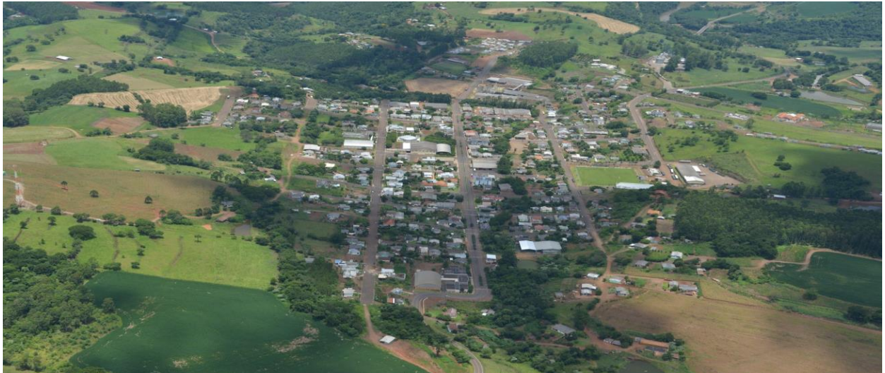
Vista aérea da Sede Município

(Art. 14, § 1º, da IN TC – 0020/2015 – TCE/SC)